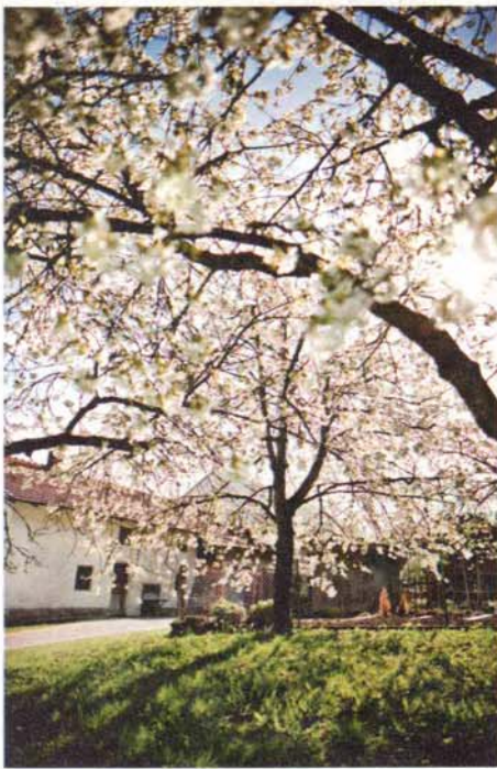
Verblüht: Quer über diesen Hof soll die Trasse führen. So steht es in den Plänen der Autobahndirektion.

Tonnen des Klimagases CO 2 stoßen deutsche Autos im Jahr aus: fast ein Achtel aller Emissionen.